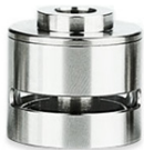
5.8 ML TANK